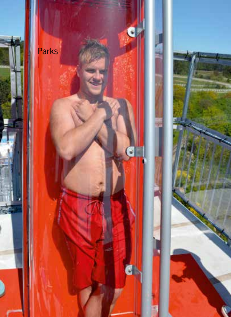
Raketenstart in luftiger Höhe.