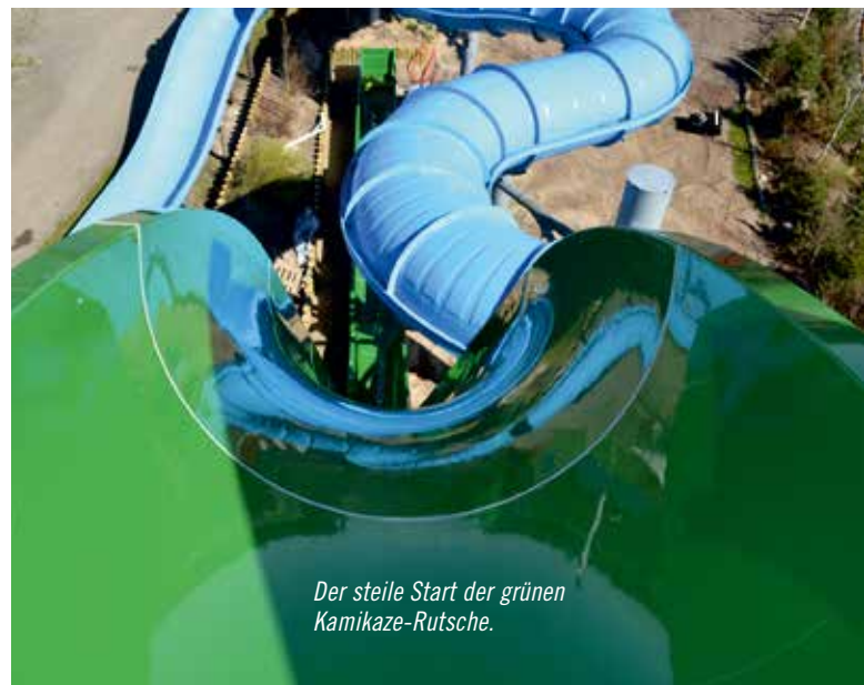
Der steile Start der grünen Kamikaze-Rutsche.

A hotel is also in preparation at the park for the upcoming year. Some six million Euros are being invested into the new hotel which is already under construction. The hotel will be an established component of the park and will be designed to radiate the typical Scandinavian natural atmosphere that people are already familiar with from the park itself. The four-star hotel will feature 51 modern rooms and offer a view of the "Falken" and "Orkanen" rollercoasters.